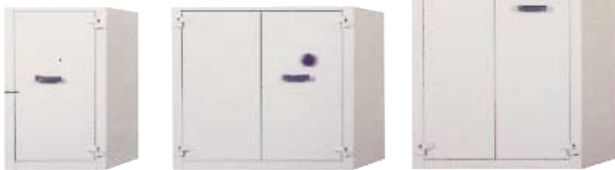
AF II est disponible en 3 volumes.

AF II est disponible en 3 volumes. Conçue pour apporter une capacité de stockage maximale, elle possède un espace intérieur entièrement modulable. Pour un accès total, les portes peuvent s'ouvrir jusqu'à 180°. AF II est conçue en tôle d'acier 20/10e, les portes sont à doubles parois d'une épaisseur de 65 mm. Quatre pènes cylindriques d'un diamètre de 20 mm assurent la condamnation de la porte.