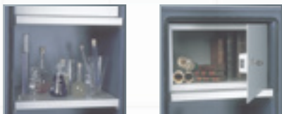
Equipements intérieurs (en partant de la gauche) : tablette, armoire à clé